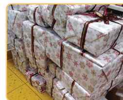
Novotrojkový Ježíšek se do toho obul

Inspirovali jsme se aktivitou Krabice od bot. Zaměstnanci, dobrovolníci a přátelé N3 připravují vánoční dárky pro děti z Prahy 3 ze sociálně znevýhodněných či pěstounských rodin. Mohou se tak těšit na panenky, autíčka, knihy, lego, voňavky, prostě na vše, o čem snily. V roce 2019 si dámy z OSPOD Praha 3 odvezly 30 balíčků pro konkrétní děti. Pro některé z nich to byl jediný vánoční dárek! Připojte se letos jako novotrojkový Ježíšek také? ■ JK