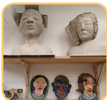
Víc hlav víc ví