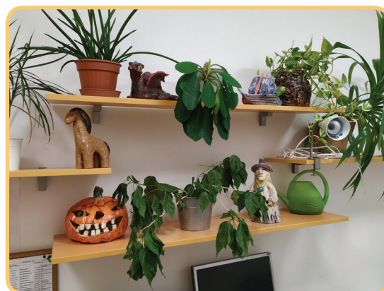
Recepce slouží i jako malá galerie