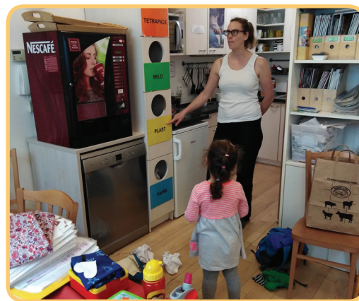
Ekologická výchova ve Školičce