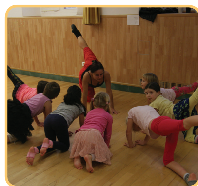
Výrazový tanec – trénink