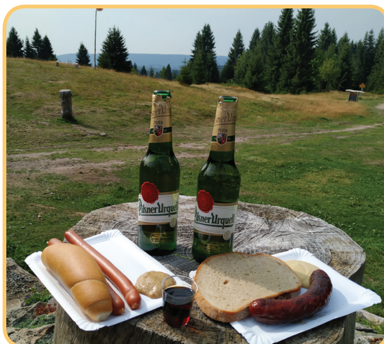
Snídaně v trávě podle JK