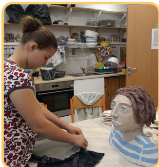
Keramický ateliér v akci

V červnu se připravujeme na léto, chystáme Den pro děti a hlavně narozeniny: Nové Trojce bude už sedmnáct let!