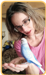
Karin a její láska