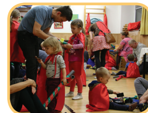
Na Martina všude samý rytíř