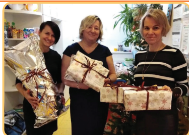
Dárky pro děti v nouzi