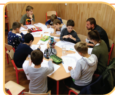
Malí architekti v pilné práci