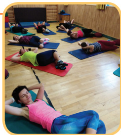
Holky cvičej bříšáky...

si popovídáme a 8 km nakonec uběhneme jen tak mimochodem.“