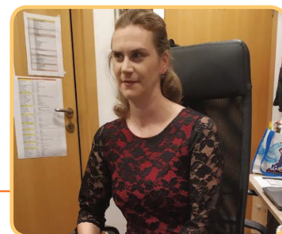
Kočka v kanceláři