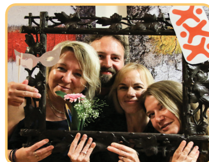
Nová Trojka a její přátelé z OSPOD Prahy3