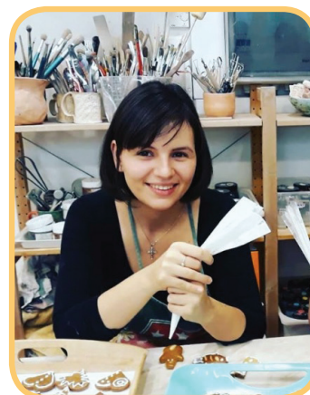
Patricie v keramice