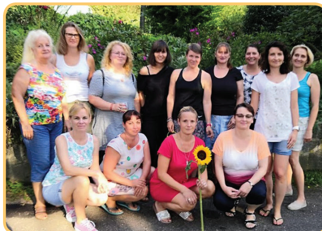
Tým Nové Trojky