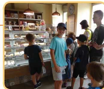
Sváča na příměšťáku bude!