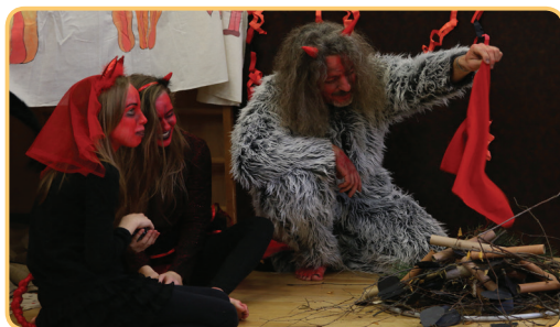
Mikuláš – čerti

V souvislosti s Novou Trojkou používám termín „sociální projekt“ nerada. Je to mnohem přirozenější a obvyklejší. Prostě se snažíme, aby i ti, kdo měli v životě méně štěstí nebo je v některé chvíli života potkalo něco zlého, mohli zažít obvykle,