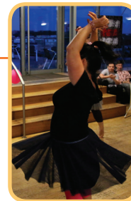
MSCH Tanečnice latinskoamerická

rytmus. Ale nemyslete si, tanec je nejen krása na pohled, ale i docela náročný pohyb, zlepšující fyziku. Tak do toho! ■