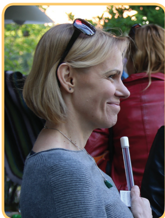
Paní ředitalka oficiální (S kým pak to asi jedná?)

My, holky z Nové Trojky, jsme si nikdy nehrály jen na vlastním písečku. Možná je to tím, že už vznik naší organizace provázela veřejný protest ☺. Vždy jsme nakukovaly za plot, co je nového a jestli by se to nedalo vylepšit.