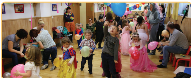
Karnevalový rej masek v plném proudu