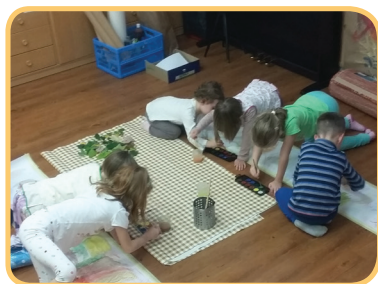
Ateliér výtvarných technik pro nejmenší