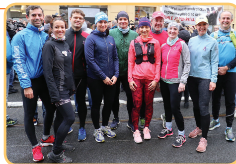
Bootcampisté po tradičním běhu na Národní