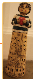
Vincetka, soška pro dobrovolníky roku