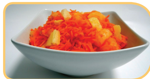
EJ Mrkvový salátek s ananase – ředitelčin mls