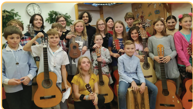
Kytaristé mají na koncertě vždy největší fanklub

Únor je prý krátký měsíc. Inu, jak pro koho. U nás je to měsíc karnevalu, jarních prázdnin, nového pololetí kurzů, dne pro dobrovolníky. Měsíc nabitý událostmi!