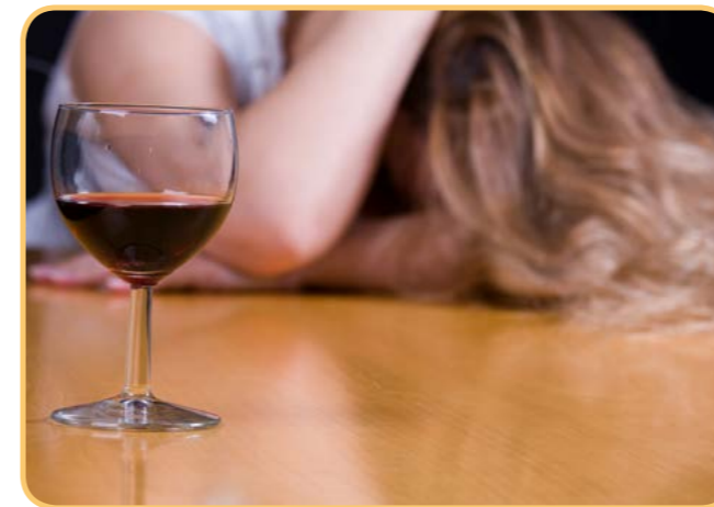
3x Ilustrační foto

Další vzorek rodinné idyly: „Máma při jídle vydává děsný zvuky.“ Tato nebohá žena by zřejmě měla jíst pouze v komůrce pro služebnou nebo by neměla jíst vůbec.